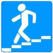
Знак 6.6. Подземный пешеходный переход