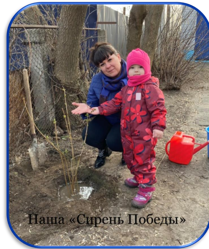
Наша «Сирень Победы»